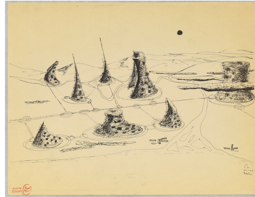
La Ville cosmique (perspective aérienne), 1964. Archives Iannis Xenakis, Bibliothèque nationale de France, Paris

Montréal, le 27 mai 2010 — Le Centre Canadien d'Architecture (CCA) présente une exposition qui explore le rôle fondamental que joue le dessin dans l'œuvre de Iannis Xenakis (1922–2001) dans sa salle octogonale. Il s'agit de la première exposition muséale en Amérique du Nord consacrée aux œuvres sur papier de Xenakis. Inaugurée le 14 janvier 2010 au Drawing Center de New York, cette exposition qui fait escale à Montréal du 17 juin au 17 octobre 2010, sera ensuite présentée au Museum of Contemporary Art de Los Angeles (MoCA), du 7 novembre 2010 au 30 janvier 2011. Véritable exposition-événement, elle donne lieu à des collaborations exceptionnelles lors de sa présentation à Montréal : seront au programme des prestations musicales du Nouvel Ensemble Moderne, de Sixtrum et d'Ensemble Transmission au CCA, ainsi que la projection de films évoquant le parcours et les œuvres de Xenakis. Des événements publics à travers la ville sont également prévus.