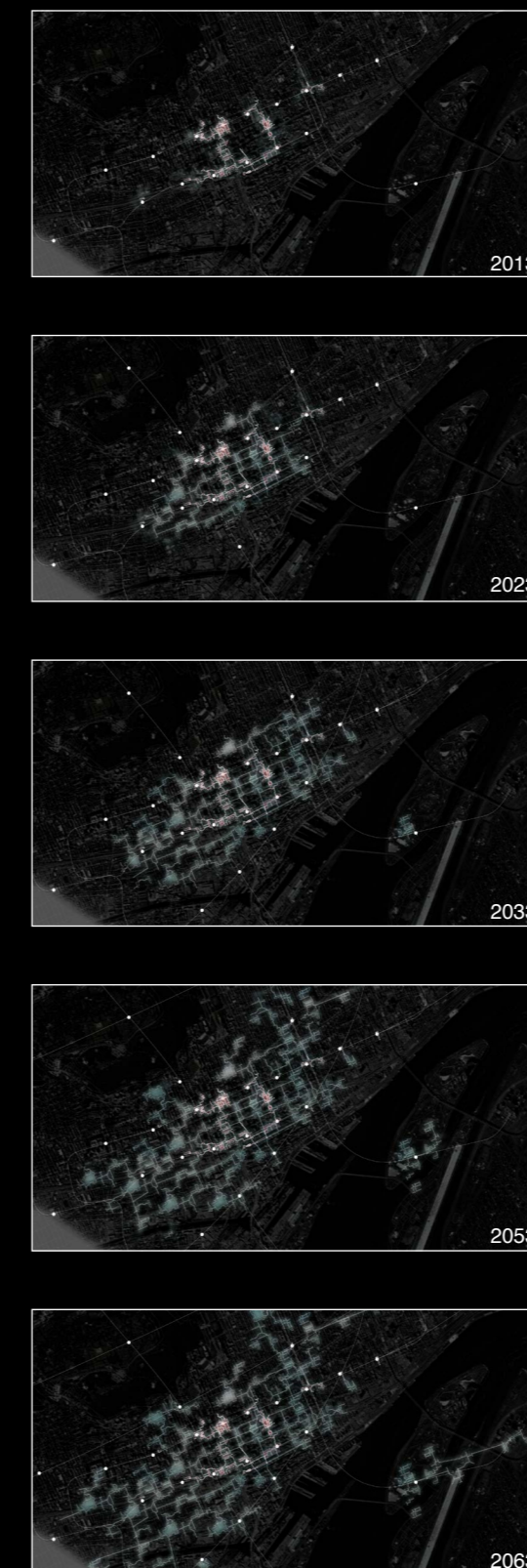
Émergence de la mégastructure souterraine et de ses réalités augmentées Emergence of the underground megastructure and its augmented realities