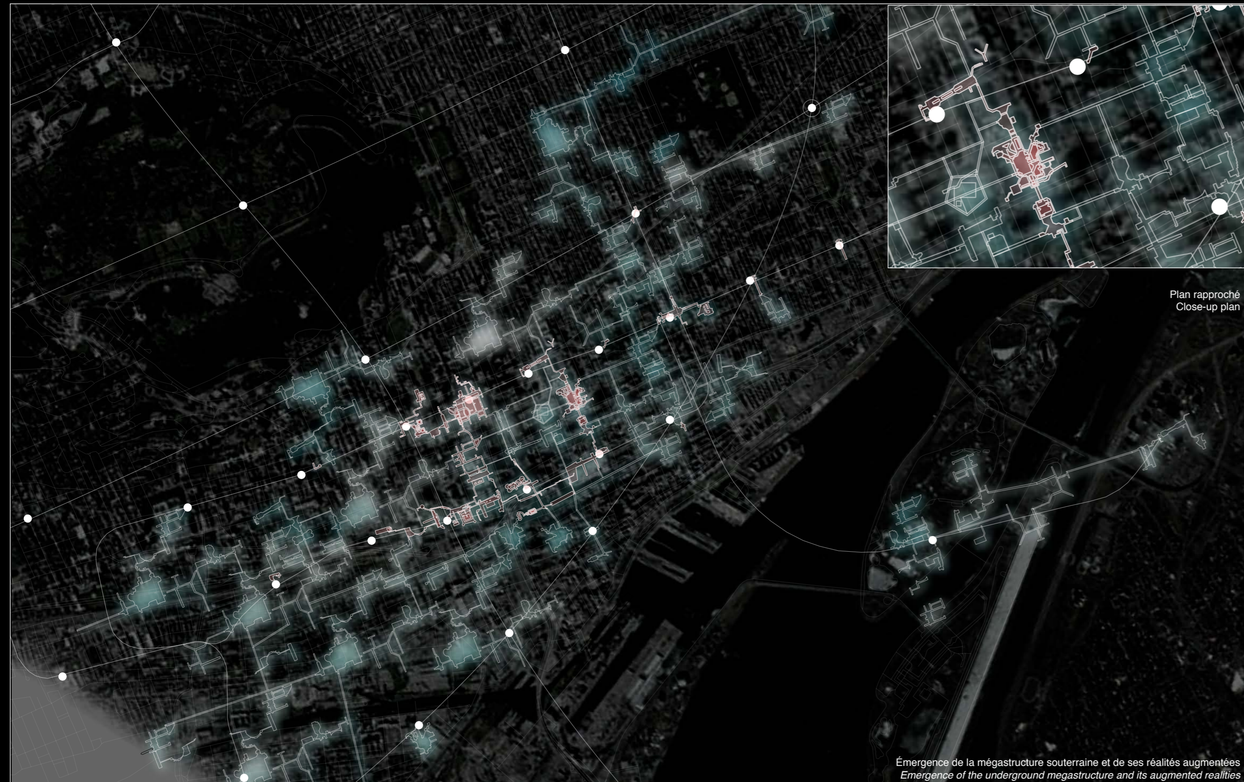
Plan rapproché Close-up plan