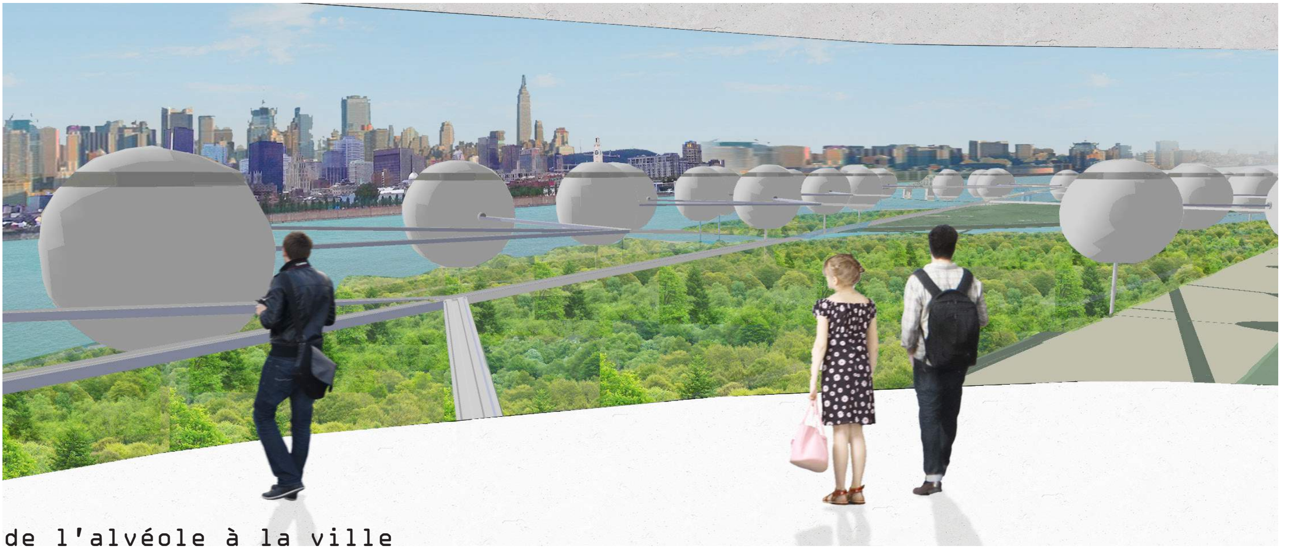
de l'alvéole à la ville